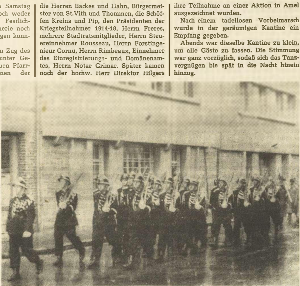
Im strömendem Regen defilierte Zug der Gendarmerie durch die Stadt