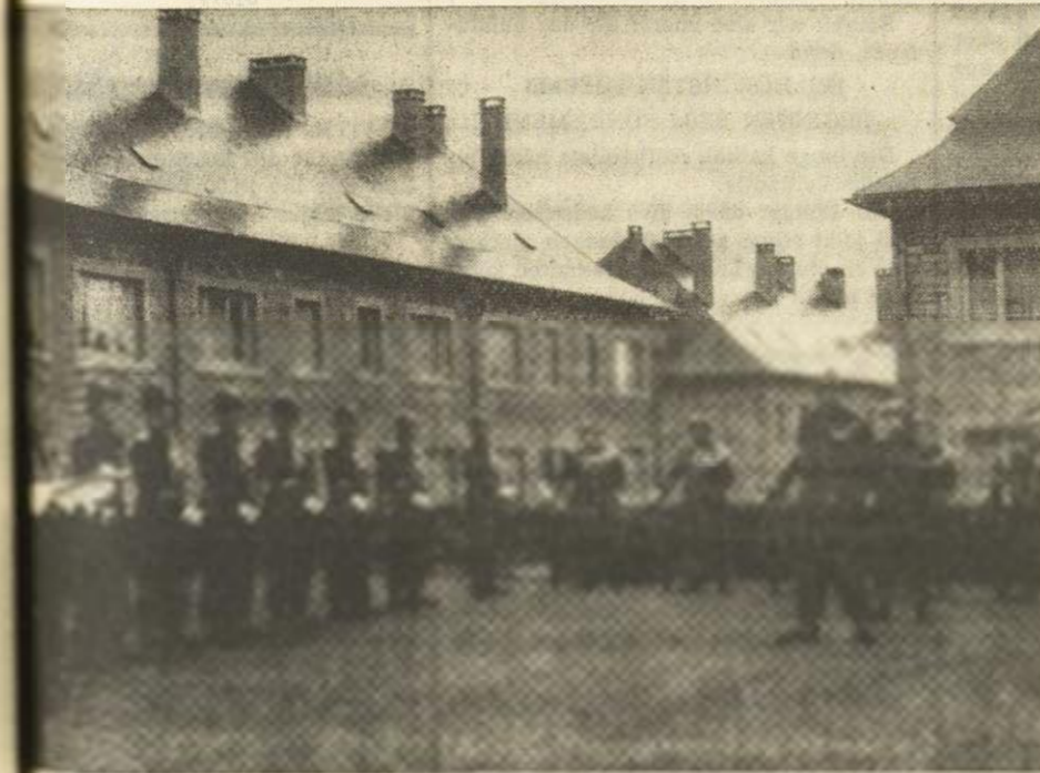
Der Ehrenzug während der Ansprache des Kommandanten Dinant