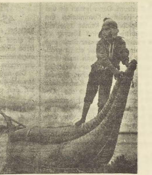
Deser Indiojunge ist trotz seiner Jugend dem Vater schon eine spürbare Hilfe — am Titicaca-see hat man vom Wirtschaftswunder noch nie etwas gehört.