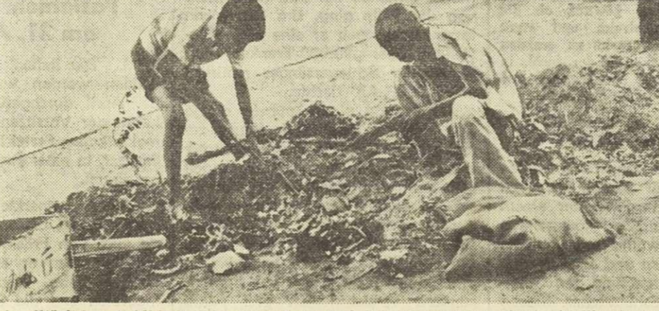
Ein alltäglicher Anblick in Schanghai, Vater und Sohn durchsuchen einen Abfallhaufen nach Essbarem. Dabei behauptet die Regierung in Peking, die Stadtbewohner seien besser versorgt als die Landbevölkerung.

einnimmt, beträgt die monatliche Reiszuteilung für Erwachsene 20-24 Kattis (12-14 Kilogramm); Kinder erhalten weniger.