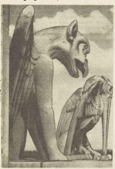
Seit 800 Jahren bewachen diese phantastischen Chimären die Kathedrale Notre-Dame de Paris.

Ein Bauernjunge machte sein Versprechen wahr - Vor 600 Jahren wurde der Grundstein zum Bau gelegt Der Tourist, der seine Pariser Streifzüge mit einem Bummel über die Ile de la Cite, jenes alte Kernstück der Stadt zwischen den Seine-Armen, beginnt, wird in diesen Tagen bitter als sonst die Geschichte - oder sagen wir besser die Legende von dem Bauernjungen Maurice de Lully hören.